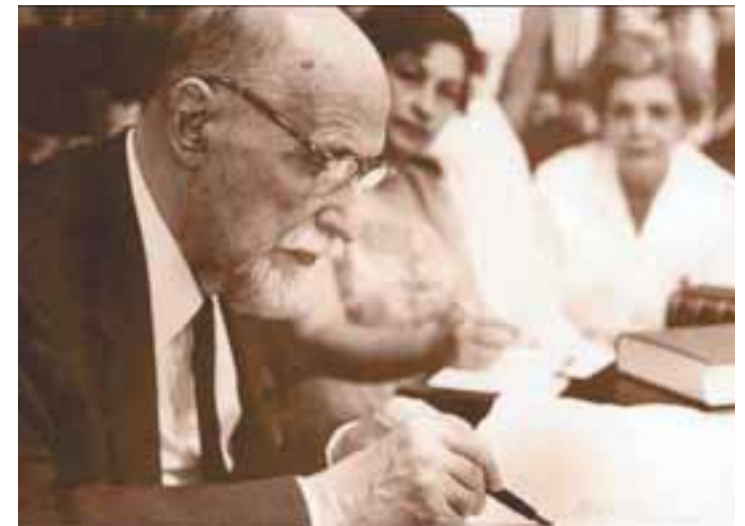
El poeta nació en Huelva en 1881 y murió en Puerto Rico en 1958.

Se publican 27 poemas inéditos del poeta Juan Ramón Jiménez con su "yo más tierno"