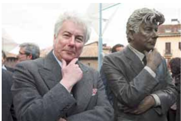
Ken Follett, junto a la escultura que Vitoria erigió en agradecimiento.